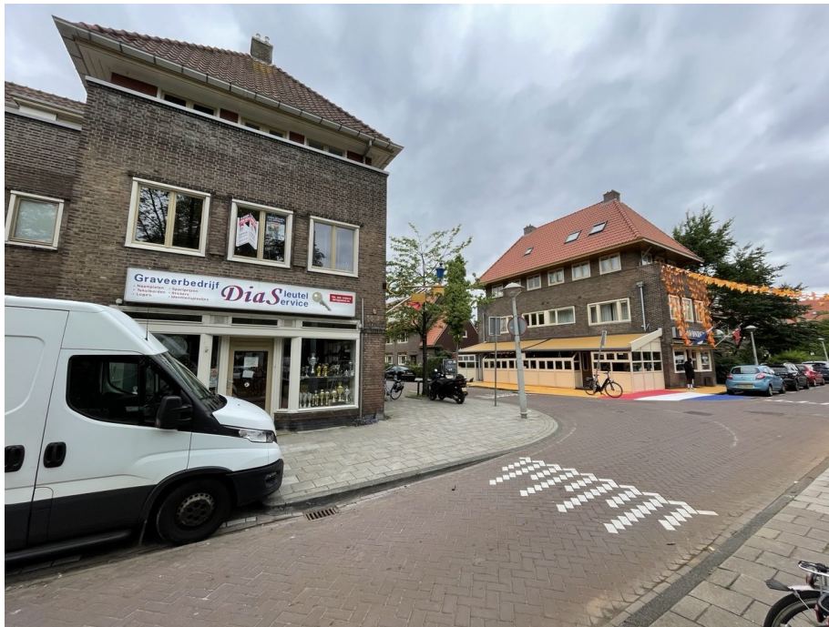
Even verder op de hoek, in oranjeferen het legendarische café 'De Avonden'.