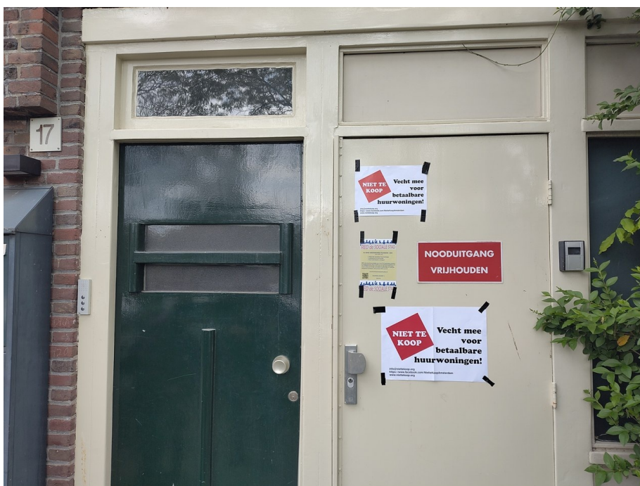
Aan de Gaaspstraat 17 was onder tweehoog ook plakruimte