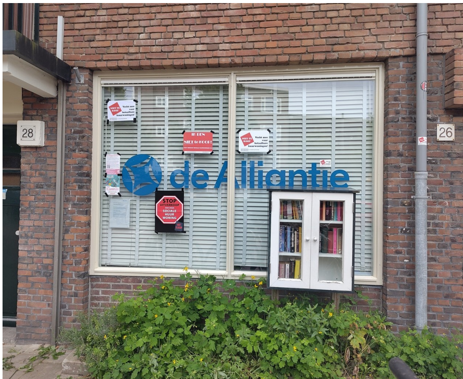
Ook het Alliantie-kantoortje op de nabije hoek kreeg een plakbeurt