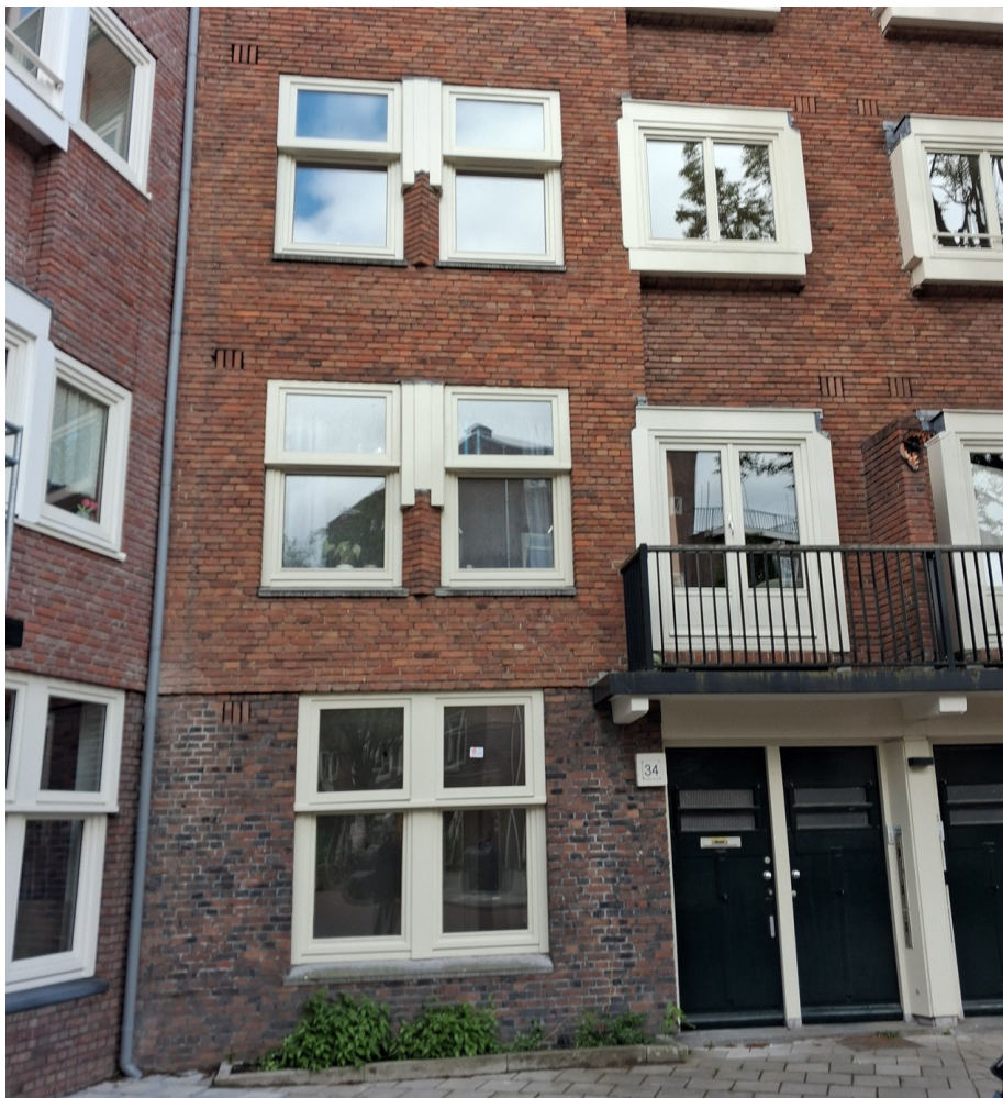
Kromme Mijdrechtstraat 34-huis+tweehoog. Driehoog is in 2024 verkocht.