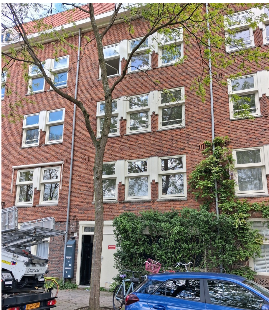
Gaaspstraat 17-2. Driehoog is onlangs verkocht, de nieuwe bewoner was tijdens deze opname