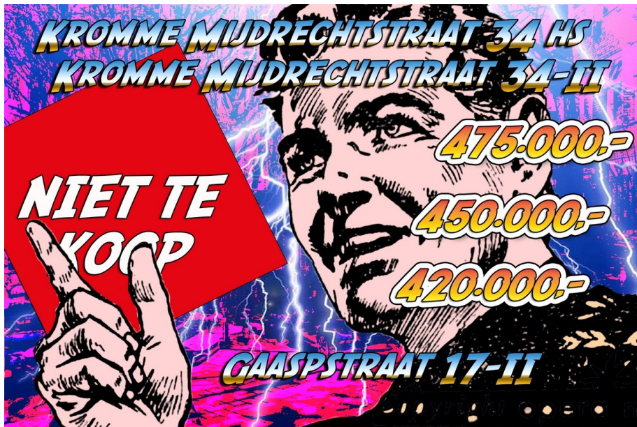
Affiche Kimbel Bouwman