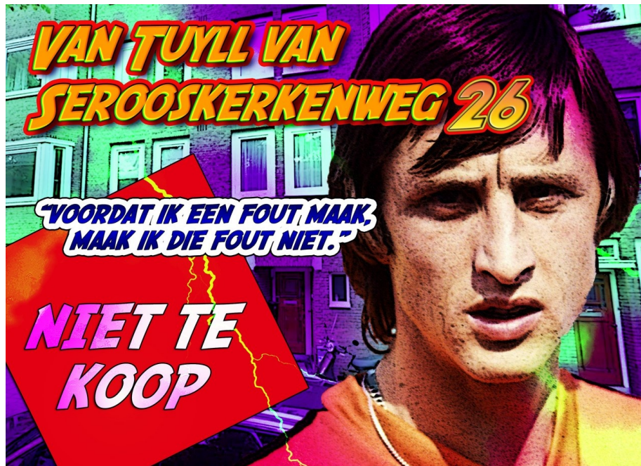
Affiche Kimbel Bouwman

Flitsactie 246 is een proactieve actie. De Alliantie heeft de benedenwoning Van Tuyll van Serooskerkenweg 26 nog niet op haar website en via Funda te koop aangeboden. Zij heeft alleen aan de omwonenden te kennen gegeven dat de leegkomende woning niet meer verhuurd zal worden, maar de verkoop in gaat. Hierover is commotie ontstaan bij de burens: waarom verkoop van deze benedenwoning? Waarom wordt er eerst niet gekeken of er belangstelling van Alliantie-huurders is? Vandaar de oproep aan de corporatie: niet verkopen maar verhuren!