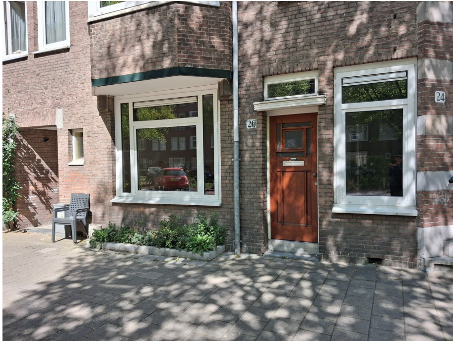
Van Tuyll van Serooskerkenweg 26

'Er zijn inmiddels meerdere omwonenden die aanspraak willen maken op de benedenwoning. Allemaal om dezelfde redenen: ze willen in de buurt en begane grond. Ze laten allemaal hetzelfde als u achter. Om die reden gaan wij geen bemiddeling toepassen, omdat er geen onderscheid mag en kan worden gemaakt tussen omliggende huurders.'