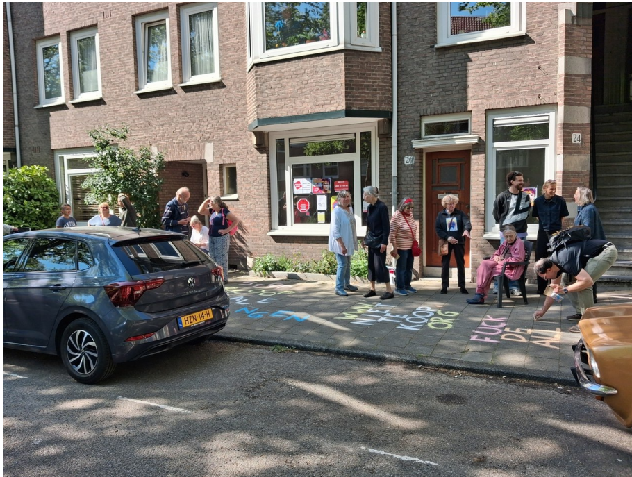
Van Tuyl van Serooskerkenweg 26 afgelopen zaterdag. Veel burens kwamen meedoen met de flitsactie.

Bent u 55+ of veel ouder en wilt u verhuizen in uw eigen woonomgeving, waar u al decennia woont, naar een beter toegankelijke benedenwoning van de corporatie waar u van huurt?